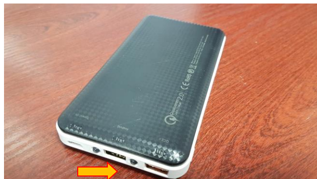
Powerbank z wyjściami zasilania USB