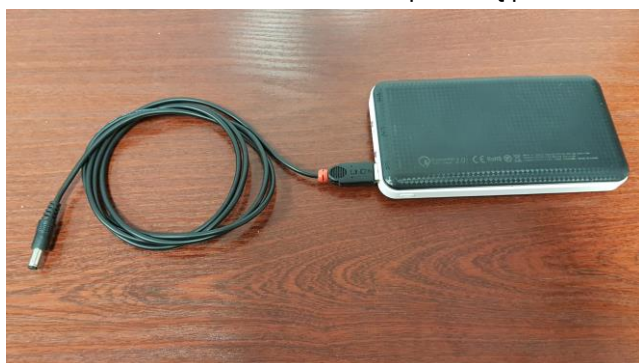
Podłącz przewód USB do wyjścia powerbanku