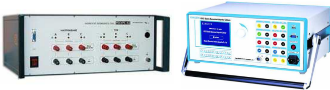
Rys. 7. Trójfazowe kalibratory mocy – ENERGOTEHNIKA Resurs-K2 [23] i KINGSIN KS833 [24]

Budową wzorca parametrów sieci niespokojnej zajmują się również ośrodki w Rosji - ENERGOTEHNIKA Resurs-K2 [23] nazwany jako wielofunkcyjny kalibrator napięć i prądów przemiennych i w Chinach - KINGSIN KS 833 [24] nazwany jako wzorzec mocy i kalibrator (rys.7). Pod względem dokładności, zakresu prądów, funkcji, gabarytów i masy, urządzenia te znacznie odbiegają od poziomu uzyskanego w omawianych wcześniej wzorcach, które wyznaczają aktualny stan techniki światowej.