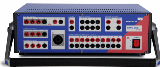
Rys. 4. Wielofazowy tester zabezpieczeń OMICRON CMC256plus [19]

Z kolei w kraju, przez dwadzieścia lat nie udało się zmniejszyć gabarytów i masy kalibratorów mocy w stosunku do pierwszego wzorca SQ 33, który ważył 45 kg. W tym czasie rozwijały się szybko wielofazowe testery zabezpieczeń, zarówno w kierunku zwiększania dokładności, jak i implementowania funkcji odtwarzania parametrów sieci. Doszło do tego, że takie testery jak ISA DRTS 6 [18] czy OMICRON CMC 256 [19] zaczęły mieć cechy wzorców parametrów sieci, co zaczęto podkreślać dwuczłonowymi nazwami, jak Protection Relay Test Set and Universal Calibrator . Potrzeba stosowania testerów zabezpieczeń w obiektach energetycznych wymusiła zmniejszanie ich gabarytów i masy. Z kolei zmniejszenie wymiarów płyty czołowej i potrzeba ergonomicznej obsługi testera i wizualizacji procesu zautomatyzowanego sprawdzania urządzeń spowodowała, że na płycie czołowej pozostawiono jedynie gniazda wyjść i wejść testera (rys.4), a funkcje programowania testera i wizualizacji procesów pomiarowych przeniesiono do programu komputerowego. Zmieniono przy tym filozofię obsługi testera na korzyść programowania procedur pomiarowych i automatyzacji testów.