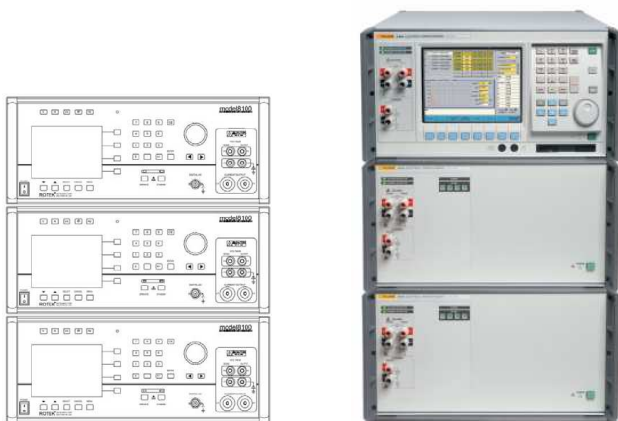
Rys. 3. Kalibratory mocy w wersji trójfazowej - ROTEK 8100 [14] i FLUKE 6100A [15]