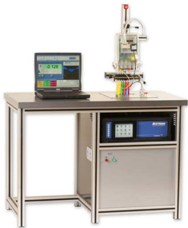
Rys. 6. Krajowa trójfazowa jednostanowiskowa stacja wzorcownicza typu LS3 [21] Fig. 6. Polish three phase stationary single position meter test station model LS3 [21]

Budową wzorca parametrów sieci niespokojnej zajmują się również ośrodki w Rosji - ENERGOTEHNIKA Resurs-K2 [23] nazwany jako wielofunkcyjny kalibrator napięć i prądów przemiennych i w Chinach - KINGSIN KS 833 [24] nazwany jako wzorzec mocy i kalibrator (rys.7). Pod względem dokładności, zakresu prądów, funkcji, gabarytów i masy, urządzenia te znacznie odbiegają od poziomu uzyskanego w omawianych wcześniej wzorcach, które wyznaczają aktualny stan techniki światowej.