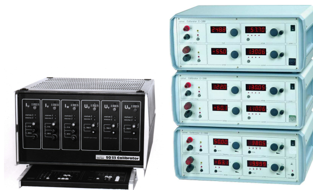
Rys. 2. Widok pierwszych krajowych trójfazowych kalibratora mocy z zastosowaniem koncepcji konstrukcyjnej 3F=3 \times 1F (kalibrator SQ33) i 3F=3 \times 1F (kalibrator C233)

Pierwszy wzorec parametrów sieci ROTEK 800 był wdrożony w 1976 roku w USA i był zaprojektowany jako zestaw trzech jednofazowych kalibratorów mocy [8]. Ta koncepcja konstrukcyjna oznaczona jako 3F=3 \times 1F utrzymana jest przez firmę Rotek do dzisiaj. Prawdopodobnie pierwszym wzorcem parametrów sieci w Europie był krajowy kalibrator LUMEL SQ33 [9], zaprojektowany jako trójfazowy kalibrator mocy w jednej obudowie wg śmiałej wtedy koncepcji konstrukcyjnej 3F=1 \times 3F (rys.2), wdrożony w 1988 roku i produkowany do dzisiaj jako INMEL 33. Urządzenia te są wzorcami parametrów sieci sinusoidalnej – odtwarzały trójfazowy wektor sinusoidalnych napięć i prądów. Już wtedy były wyposażone w wejścia impulsowe do realizacji funkcji testera liczników energii. Pierwszy krajowy wzorec parametrów sieci niesinusoidalnej CALMET C233 [10], zaprojektowano jako zestaw trzech jednofazowych kalibratorów mocy (koncepcja 3F=3 \times 1F ) z funkcją programowania wartości zniekształceń o widmie fali prostokątnej i wdrożono w 1993 roku. Kolejny (2003r) krajowy wzorec parametrów sieci niesinusoidalnej INMEL 8033 [11] miał już funkcję programowania harmonicznych. Koncepcja tych wzorców bazuje na systemie pomiarowym z kalibratorem kontrolnym i są one nazywane jako kalibratory mocy i energii (Power and Energy Calibrators).