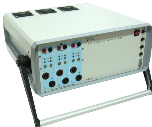
Rys. 5. Trójfazowy kalibrator mocy CALMET C300 [20]

Zaobserwowany trend rozwoju testerów zabezpieczeń wykorzystano w projekcie pierwszego krajowego wzorca parametrów sieci niesinusoidalnej i niespokojnej – kalibratora C300 [2] (rys.5), w którym w stosunku do wcześniejszych krajowych wzorców parametrów sieci spokojnej polepszo dokładność do klasy 0,05, rozszerzono zakres prądów do 3x100A, zmniejszono gabaryty i masę do 32 kg, zredukowano cenę o 30%.